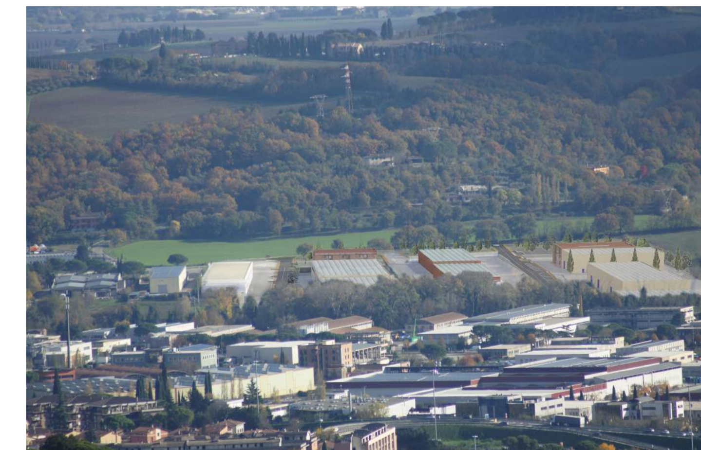
Foto_C_Configurazione di progetto