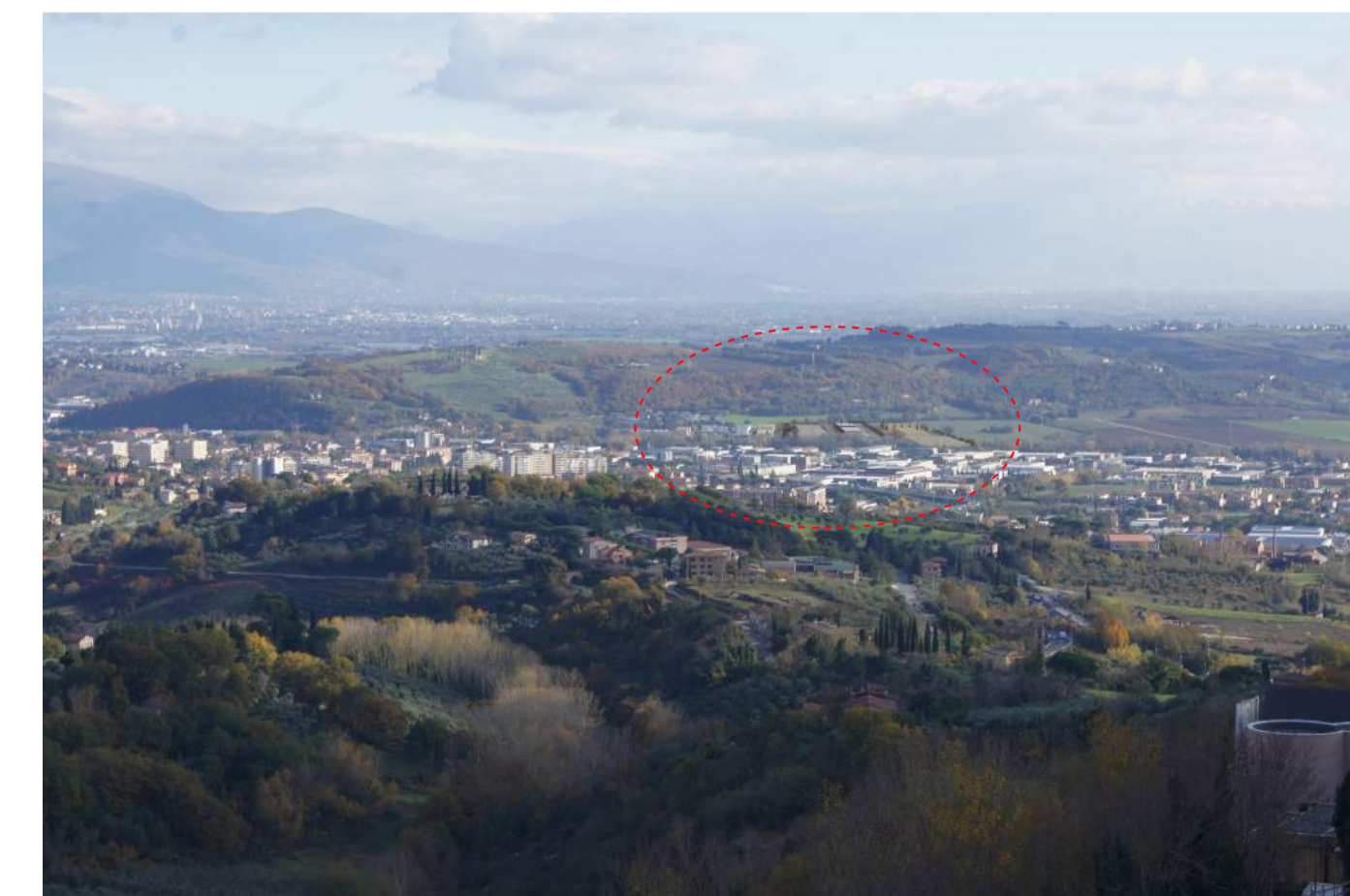
Foto_B_Configurazione di progetto