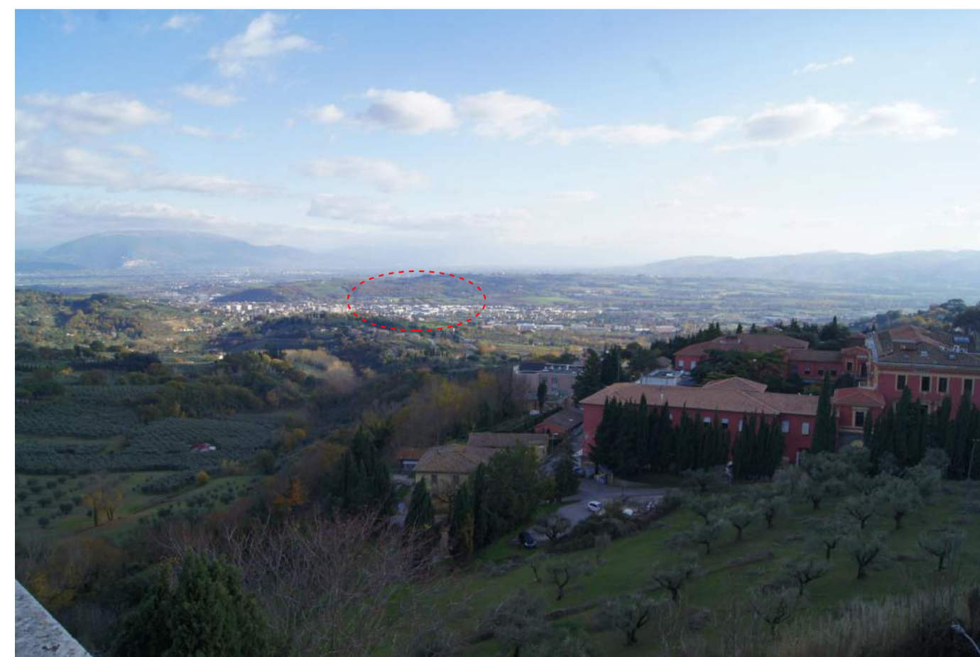
Foto_A_Configurazione di progetto