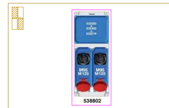
Gruppo prese interbloccate 3 x 32 + T e 3 x 63 + T