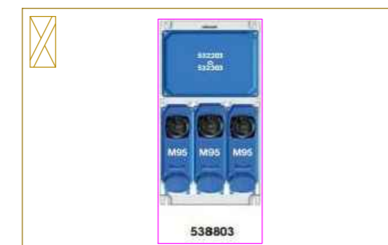
Gruppo prese interbloccate da 2x16A + T