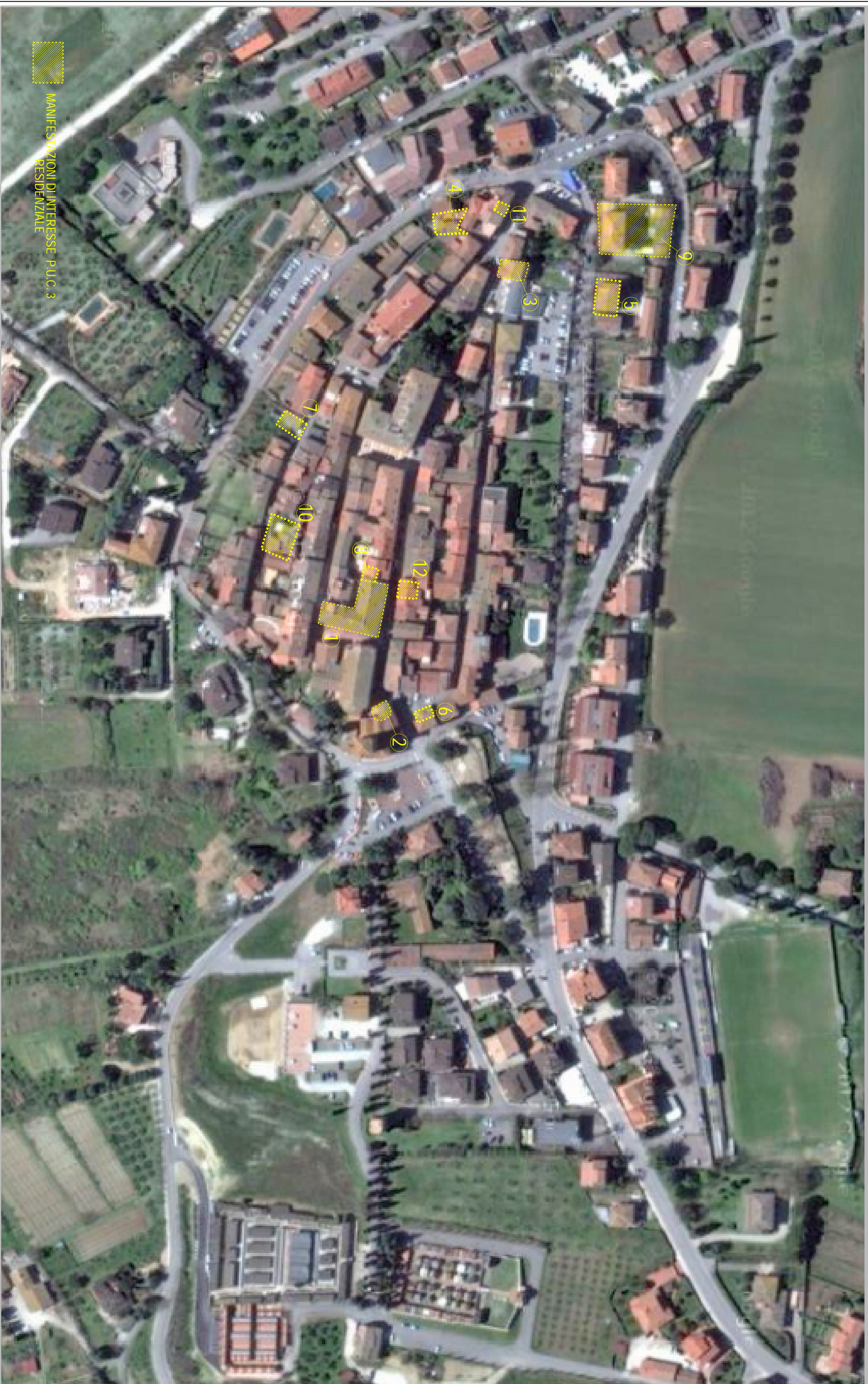
TAVOLA 3a - MANIFESTAZIONE DI INTERESSE P.U.C. 3 - VISTA AEREA - RESIDENZIALE