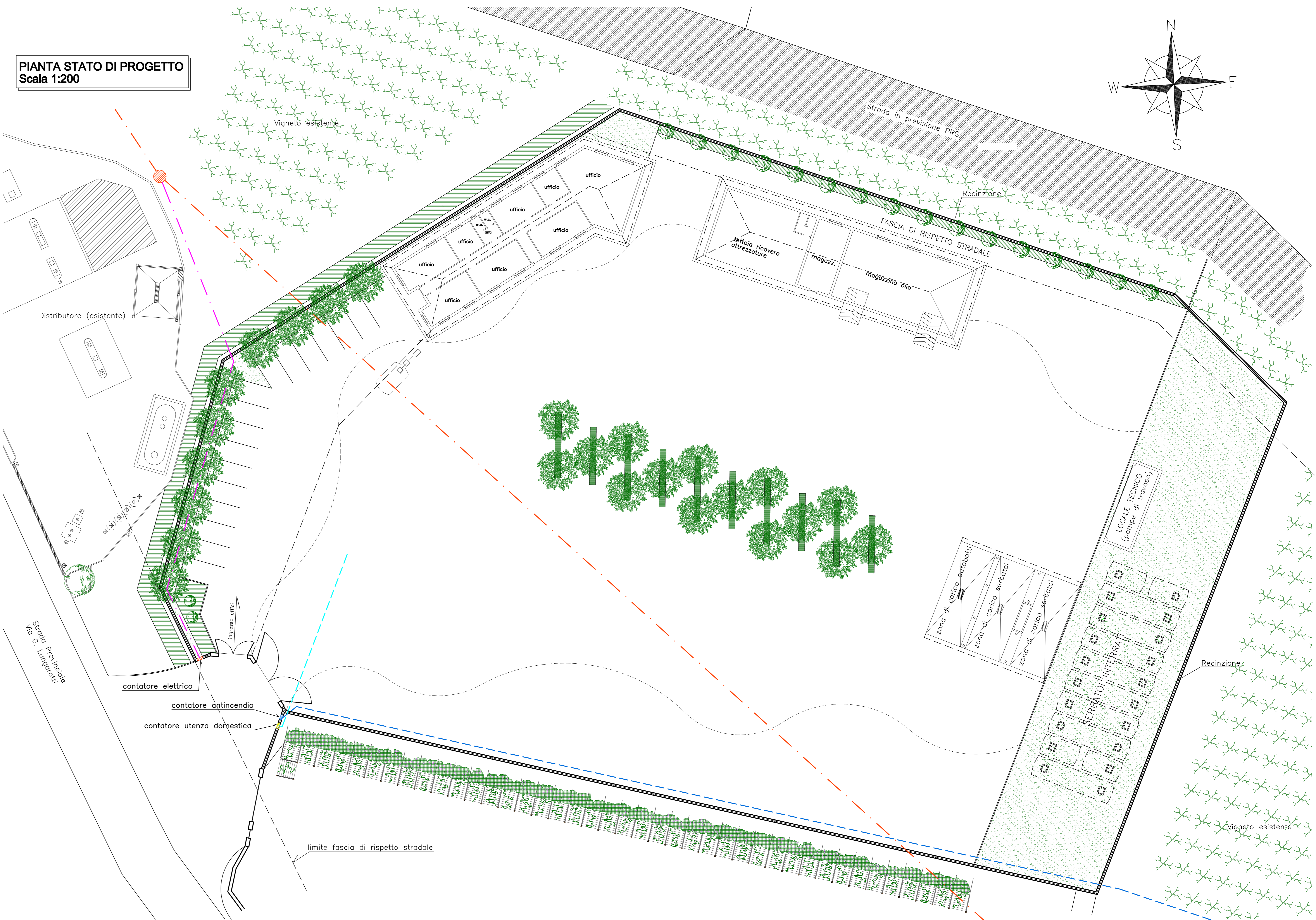
PIANTA STATO DI PROGETTO Scala 1:200